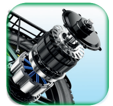
Potente Motor 55Nm