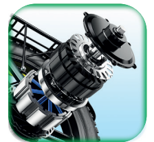
Potente Motor 55Nm