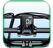
Pantalla LED Color