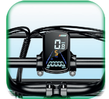
Pantalla LED Color